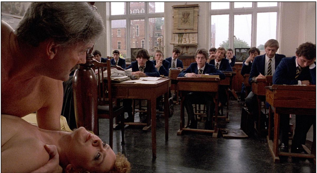
Scenen "Sex Education" i Monty Pythons (1983) "The Meaning of Life".

Derfor vil kurset sætte deltagerne i stand til at evaluere deres brug af humor så tilstrækkelig præcist til at de løbende kan tilpasse humoren til klassen og konteksten for at opnå de ønskede virkninger.