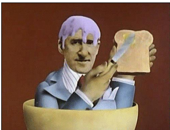
Tegning af Terry Gilliam, Monty Python.

Derfor træner kurset læreres navigering i humor som socialt fænomen. Dels ved at lærere trænes kollektivt og lærer af hinanden, dels ved at der trænes i mobilisering af elevernes humor.